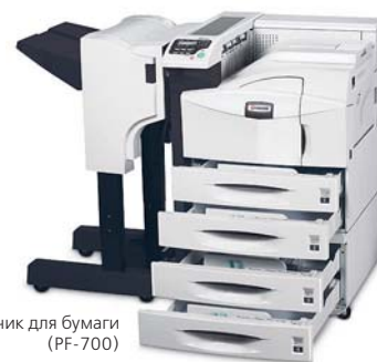
Податчик для бумаги (PF-700)

Принтер изображен с дополнительными устройствами