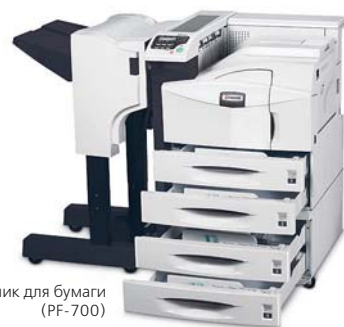
Податчик для бумаги (PF-700)

Принтер изображен с дополнительными устройствами